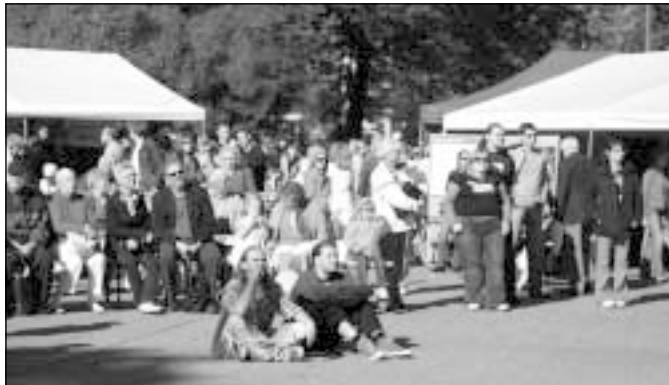
Maailmapäev toob Tallinnas Tammsaare parki kokku arengukoostööst huvitatud.

Koostöös Eesti Välisministeeriumiga korraldatakse kolmandat aastat järjest Eesti avalikkusele suunatud tasuta kogupereüritust Maailmapäev, mille eesmärk on tõsta Eestis elavate inimeste teadlikkust arengukoostööst, Eesti arengukoostöö