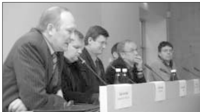
Üks näide poliitikute kaasamisest oli vabaühenduste valimiselne manifest, mida erakondadega arutati veel enne avaldamist. Veebruaris kutsuti poliitikud avalikule debatile oma seisukohti ütlemaks.