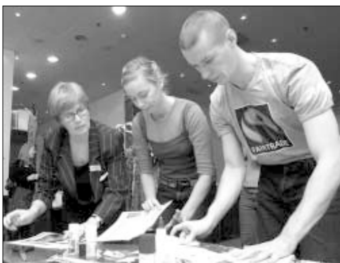
Elmises konverentsil õpetasid keskkonnaühendused muuhulgas vanapaberit uuesti kasutama.

Tänapäevastes ühiskondades ongi muutuste keskmeks head inimesed. Kõige olulisemad küsimused on sellised, mille lahendamises saab osaleda igaüks, kuid mida ei saa lahendada keegi üksi. Kes on