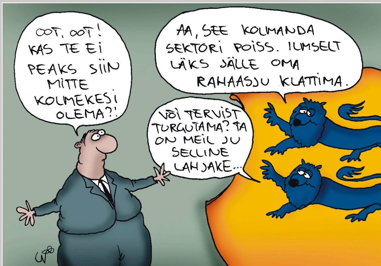
Karikatuur: Urmas Nemvalts

EMSLi visiooniks on osalusel ja kodanikualgatusel toimiv kodanikuühiskond, milles EMSLil on siduv roll avalikes huvides tegutsevate ühenduste ja ühiskonna vahel.